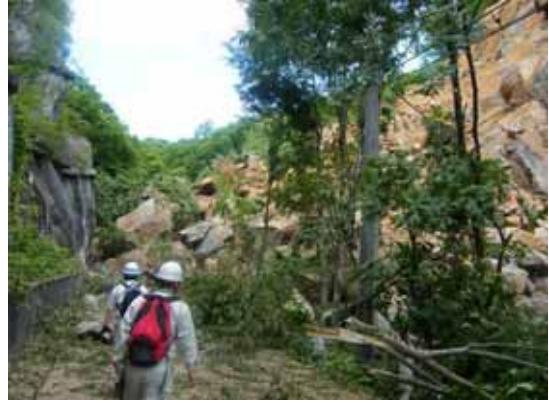
- 主要地方道 築館栗駒公園線 (栗原市沼倉地内)