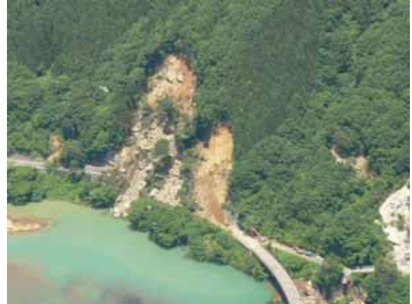
- 一般国道342号 (一関市矢櫃地内)