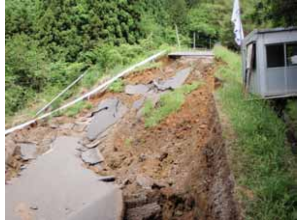
- その他市道外ノ沢線 (奥州市衣川区外ノ沢地内)