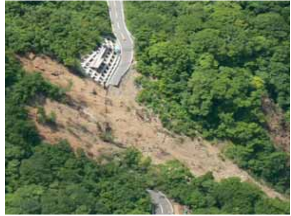
- 一般国道342号 (一関市須川地内)