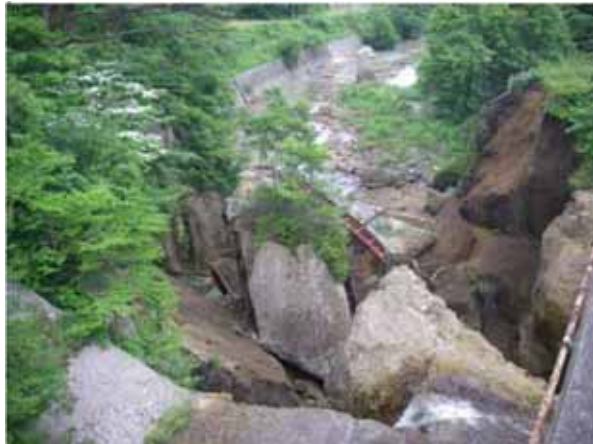
- その他市道矢櫃線 (一関市矢櫃地内)