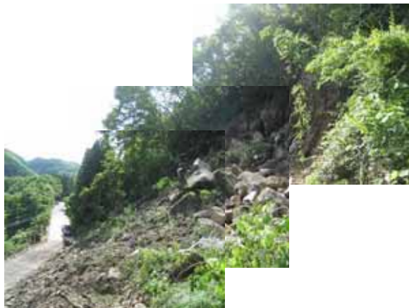
- 一般国道342号 (一関市白崖地内)