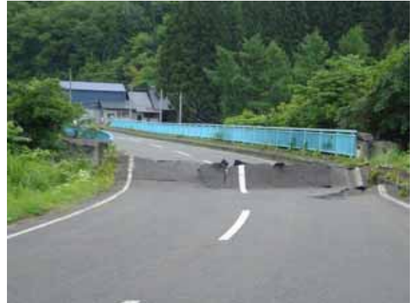
- 主要地方道栗駒衣川線(餅転橋) (奥州市衣川区餅転地内)