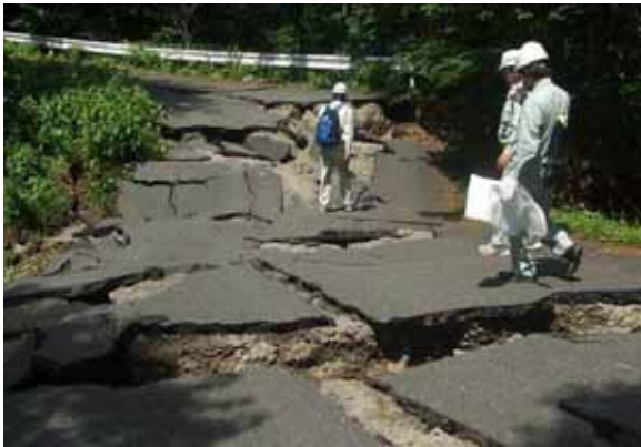
- (市)馬場駒の湯線 (栗原市沼倉地内)