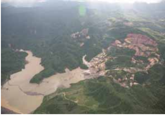
- 荒砥沢ダム (栗原市栗駒文字荒砥地内)