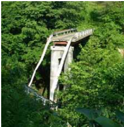
- その他市道他増沢向線(増沢向橋) (奥州市衣川区増沢地内)