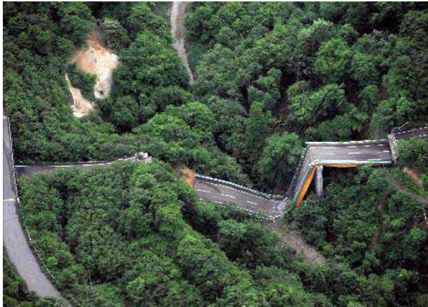
- 一般国道342号(祭時大橋) (一関市祭時地内)