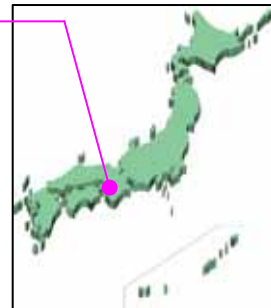
日本全国鉄道お宝マップ (和歌山県)

和歌山電鐵貴志川線では、話題づくりと利用促進を図るため、貴志駅に併設する小売店主の飼い猫「たま」「ミーコ」「ちび」を、貴志駅の駅長と助役に任命しました。「たま」の写真集まで発行されています。