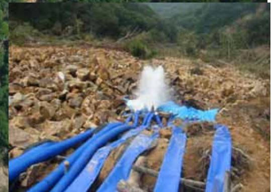
排水ポンプ稼働状況