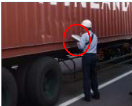
〈二次検査イメージ〉