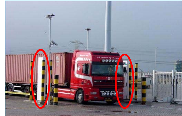
〈一次検査イメージ〉