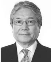
青木 保(あおきたもつ)

文化人類学者/文化庁長官 1938年(昭和13年)東京都生まれ。東京大学大学院修了(文化人類学専攻)、大阪大学で博士号取得(人間科学)。東京大学助手、大阪大学助教授、教授、東京大学教授、政策研究大学院大学教授などを経て、2007年4月文化庁長官。1965年以来東南アジアをはじめアジア各地で文化人類学的フィールドワークに従事。ハーヴァード大学客員研究員、仏国立パリ社会科学高等研究院客員教授、独コンスタンス大学客員教授などを務めた。日本民族学会(現文化人類学会)会長(1994-96)。サントリー学芸賞、吉野作造賞、紫綬褒章(受賞、受章)。主な著書:「多文化世界」「異文化理解」「境界の時間」「儀礼の象徴性」「逆光のオリエンタリズム」(以上、岩波書店)、「『日本文化論』の変容」「アジア・シネマ」「タイの僧院にて」(以上、中央公論新社)、「文化の翻訳」(東大出版会)他。