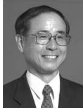
村上周三(むらかみしゅうぞう)

独立行政法人建築研究所理事/東京大学名誉教授 1942年(昭和17年)愛媛県生まれ。東京大学工学部建築学科卒。東京大学生産技術研究所教授、デンマーク工科大学客員教授、慶應義塾大学理工学部教授を経て現職。工学博士。研究分野は建築・都市環境工学、地球環境工学、サステナブル建築等。日本建築学会会長のほか、国土交通省中央建築士審査会会長、国土交通省社会資本整備審議会環境部会会長等を歴任し、環境モデル都市の選定や国土交通省住宅・建築物省CO2推進モデル事業の選定にも携わる。主な著書に「サステナブル生命建築」(監著・共立出版)等。