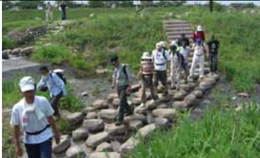
河川を核とした地域活性化(最上川)