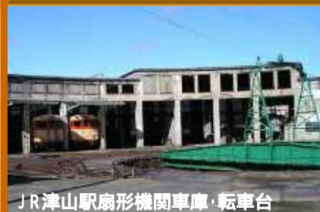
JR津山駅扇形機関車庫・転車台