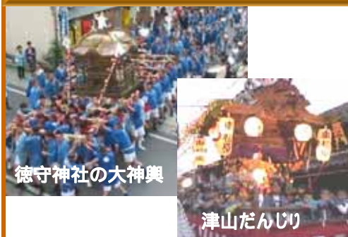
徳守神社の大神輿