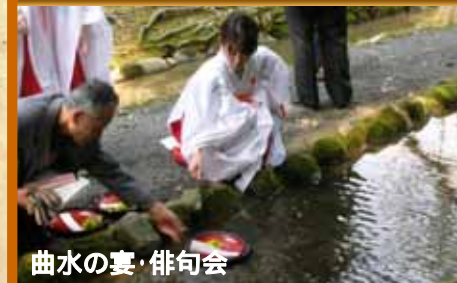
曲水の宴・俳句会