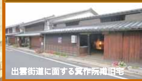
出雲街道に面する箕作阮甫旧宅