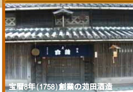
宝暦8年(1758)創業の効田酒造