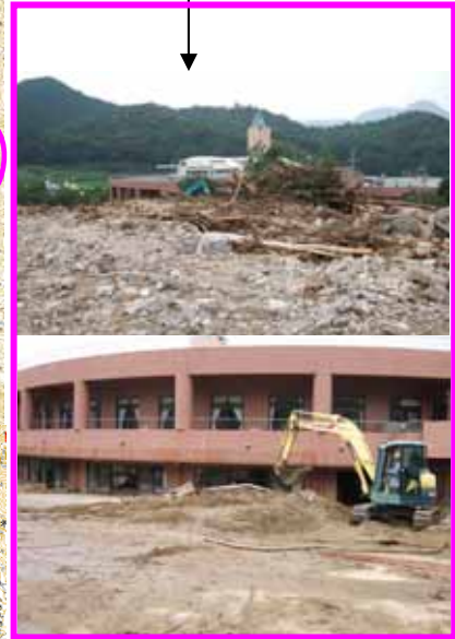
上田南川(うへだみなみかわ) 内容:砂防えん堤工1基(高さ11m)