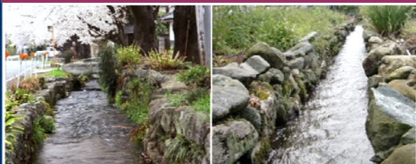
雄川堰（左：大堰／右：小堰）