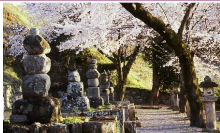
織田家七代の墓（町指定史跡）