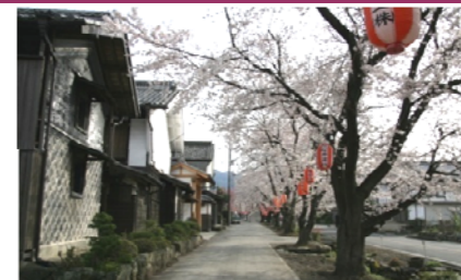
町家地区の雄川堰沿いの道路

歴史的建造物が数多く残る町家地区、名勝楽山園に通じる中小路等の県道、町道における照明整備、無電柱化等の整備