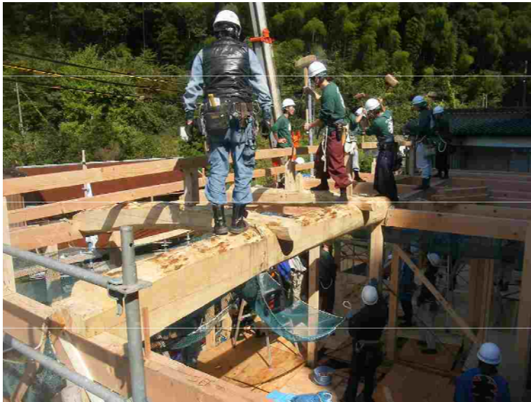
塾生による建て方の風景