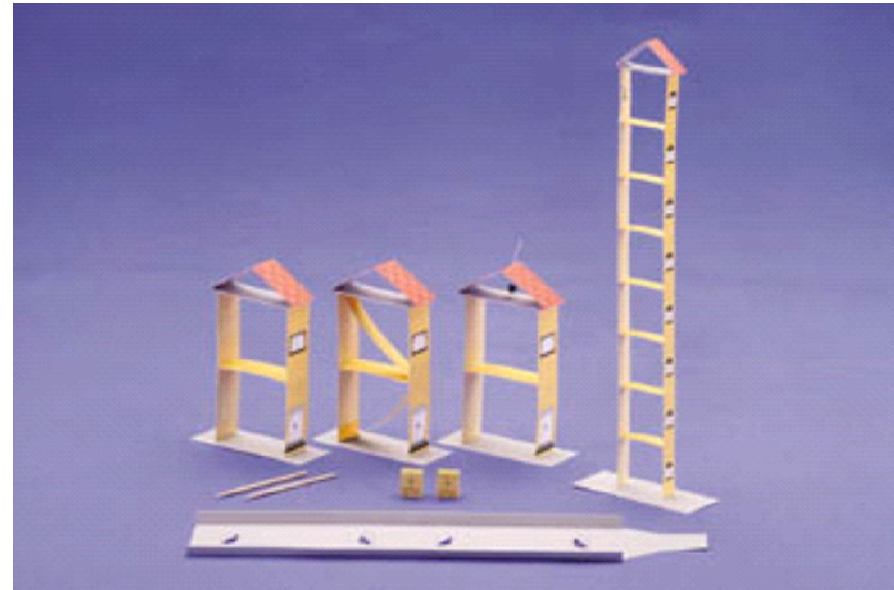
防災学習キット「ゆらり」