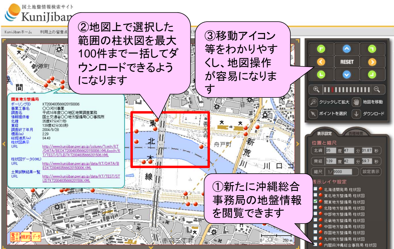
図-1 電子国土を利用した地盤情報の新閲覧画面