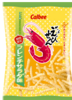
かっぱえびせんフレンチサラダ