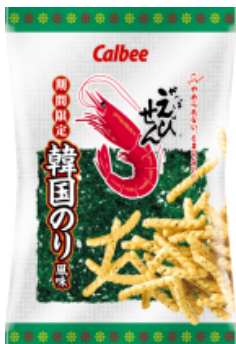
かっぱえびせん韓国のり