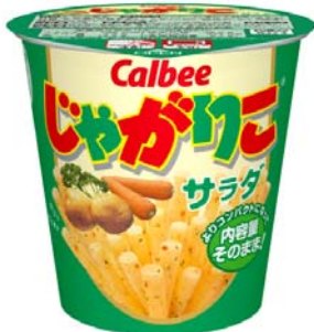
じゃがりにサラダ