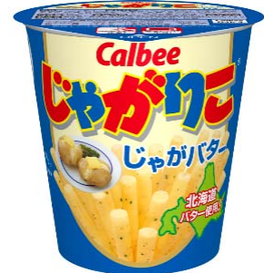
じゃがりにじゃがバター