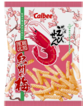
かっぱえびせん紀州の梅