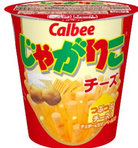
じゃがりにチーズ