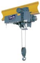
日立ロープホイス