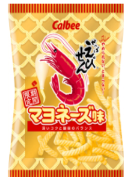
かっぱえびせんマヨネーズ