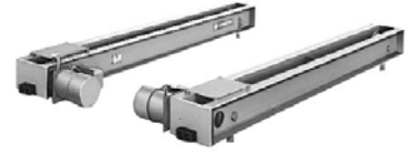
日立クレーンサドル