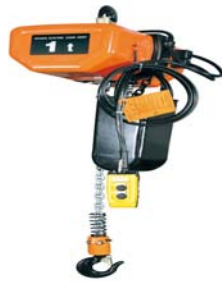
日立モートルブロック