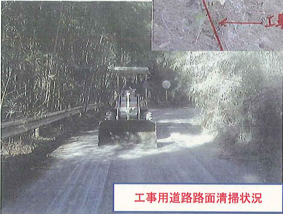
工事用道路路面清掃状況