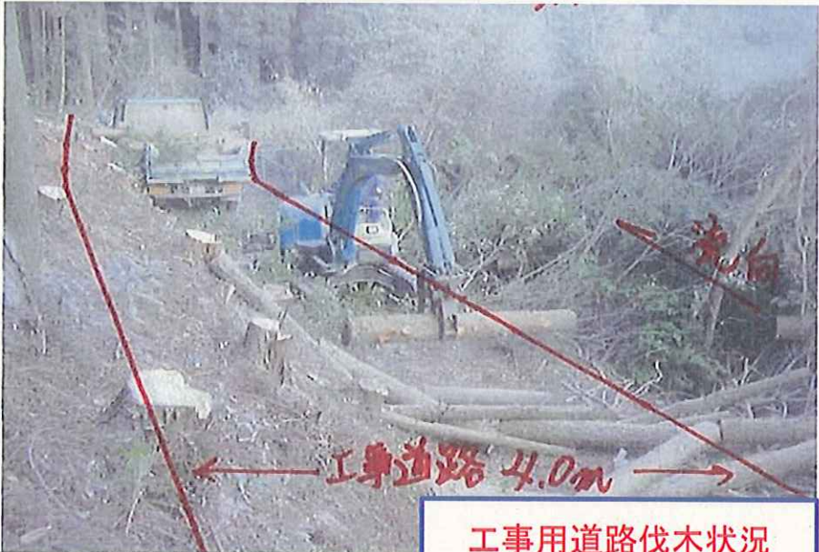
工事用道路伐木状況

はらいがわ 祓川第1砂防堰堤付近 にしもろかたぐん たかはるちょう (宮崎県西諸県郡高原町地内)