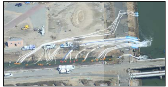
ポンプ車(60m 3 /min、40m 3 /min、30m 3 /min級)稼動状況