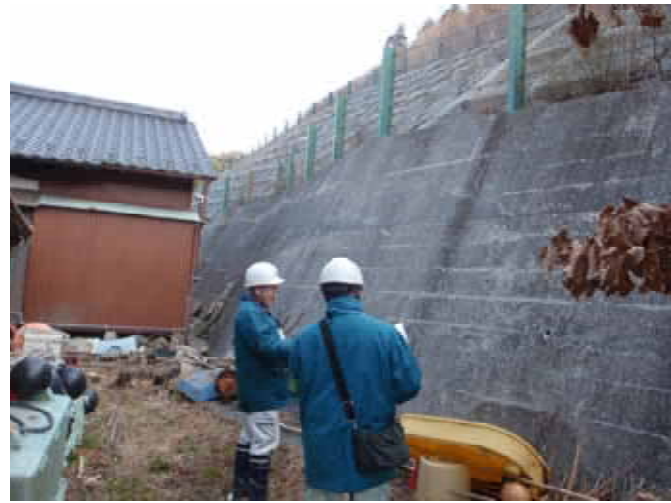
砂防設備の点検状況 (岩手県大船渡市)