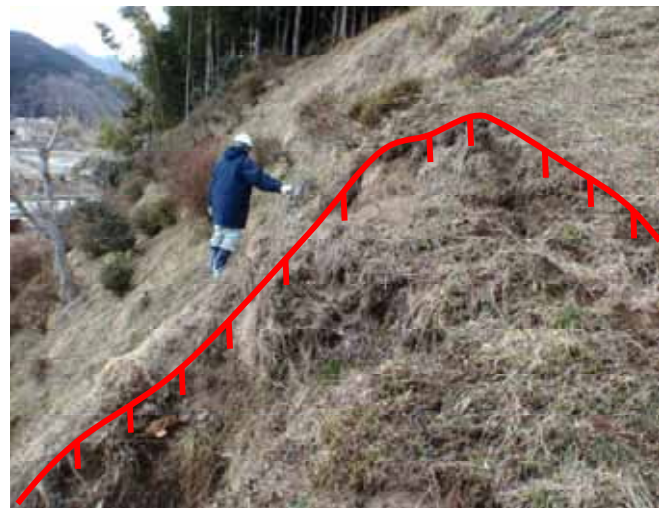
地すべり発生箇所の点検状況 (岩手県陸前高田市)