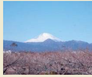
曾我梅林と富士山

伝統的な梅の栽培が行われる曾我梅林を中心とした地域は、梅の木々や梅香、梅干製造などの農家の営みとが一体となって独特な景観を形成しています。