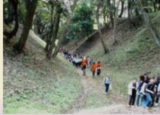
今も残る総構の遺構 (小峯御鐘ノ台大堀切東堀)

小田原城八幡山古郭・総構の保存活用等を図ることにより、城下町と一体となった歴史的環境の形成を促進します。