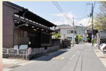
板橋地区周辺のまちなみ