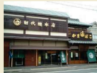
出桁造りの伝統的商家

東海道屈指の宿場町であった小田原の台所を担った千度小路周辺には、蒲鉾や削り節、干物などの製造・販売を行う伝統的な商家やそれらの店舗が多く集積するかまぼこ通りと呼ばれる通りなどがあり、そこで行われる歴史と伝統を今に受け継ぐなりわいと一体となって良好な環境を形成しています。