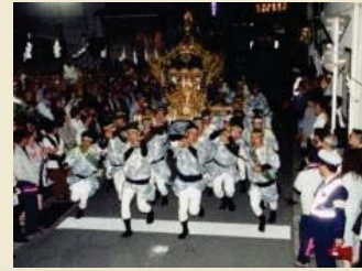
松原神社神輿の宮入

旧くは三大明神と称された松原神社、居神社、大稲荷神社で行われる例大祭では、それぞれの歴史と伝統を受け継いだ神輿を担ぐ氏子たちの勇壮な姿や木遣りの甚句、お雛子の笛の音などが今も賑やかに行われ、周辺の地域と一体となって良好な環境を形成しています。