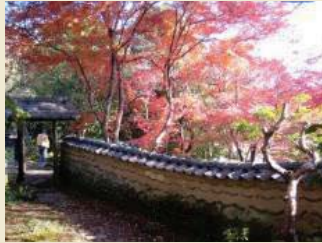
老櫓荘からみた紅葉

板橋地区周辺には、小田原北条氏の時代から続く社寺群や近代に相次いで建てられた政財界人たちの別邸などが良好なまちなみの中に残り、そこでは古くから庶民に信仰されてきた宗教行事や民俗行事が今も行われています。