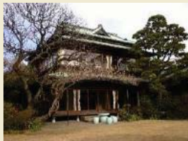
小田原文学館別館 (白秋童謡館)