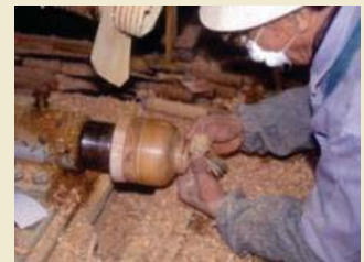
小田原漆器製造の様子

小田原漆器をはじめとする伝統工芸は、それぞれの歴史と伝統を受け継ぎながら現在も行われ、小田原に住む人々の生活などと一体となって良好な環境を形成しています。