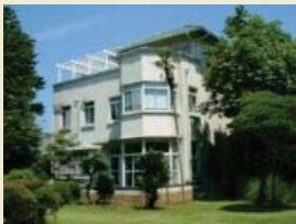
小田原文学館本館

国登録有形文化財である小田原文学館（本館・別館）の修繕を実施し、周辺の歩行者空間の整備等とあわせて、まちなかを回遊する際の休憩施設としての機能を付加する整備を行います。