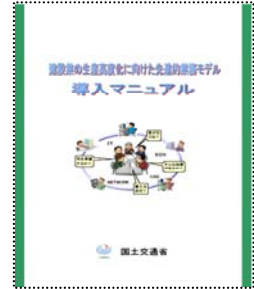
CI-NET導入 マニュアル (冊子)