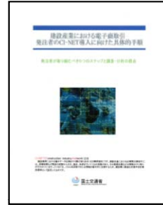
発注者のCI-NET 導入に向けた 具体的手順