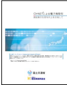
CI-NETによる 電子商取引 (パンフレット)