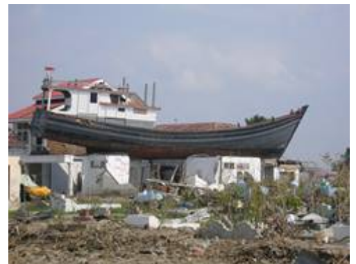
2004年インド洋津波 (インドネシアスマトラ島)