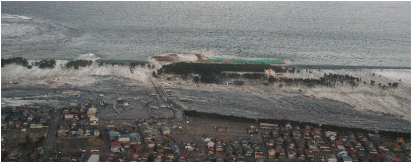
2011年東日本大震災津波 (名取市)