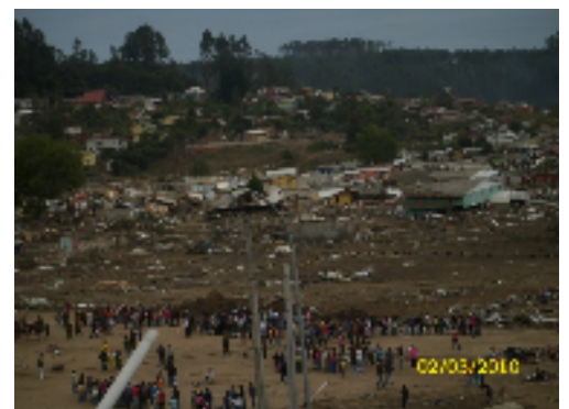
2010年チリ地震津波 (チリ)