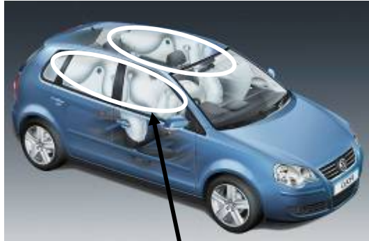
基準不適合発生箇所