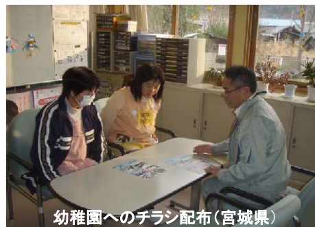
幼稚園へのチラシ配布(宮城県)