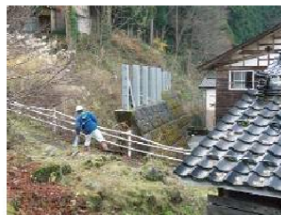
点検結果の公表(富山県ホームページより)

施設の機能に影響を及ぼすような損傷等は確認されませんでした が、集落を雪崩災害から守るため、引き続き施設の整備や適切な管理を実施します。