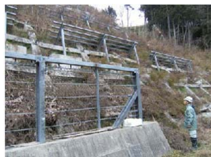
雪崩防止施設点検(宮城県)