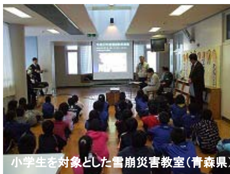
小学生を対象とした雪崩災害教室(青森県)