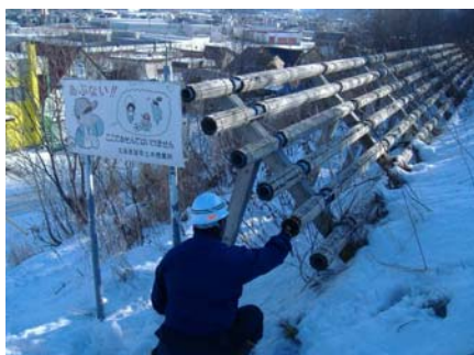
雪崩防止施設点検(北海道)