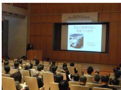
雪崩災害防止セミナー(岐阜県)