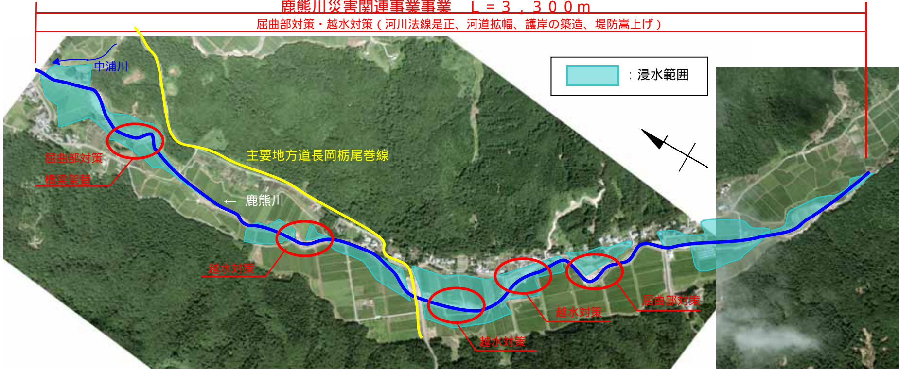
屈曲部対策（屈曲部是正、河道拡幅）