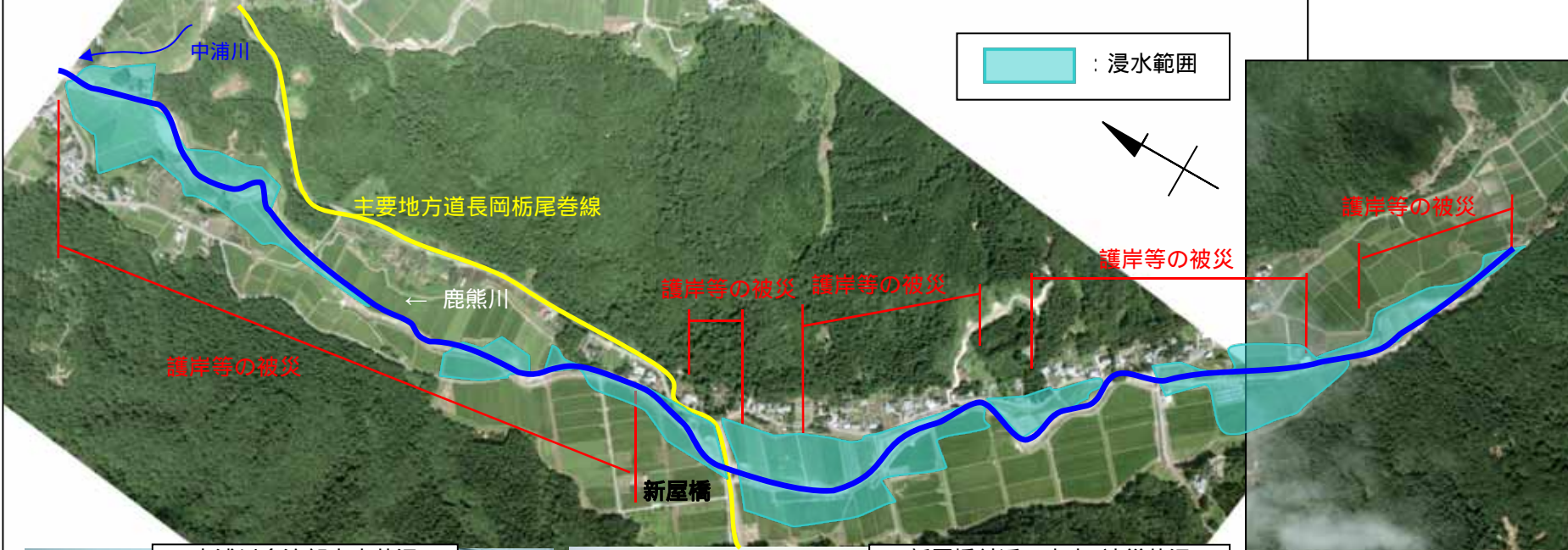
中浦川合流部出水状況

平成23年7月福島豪雨により、鹿熊川上流部では越水による氾濫被害が発生した。この洪水により農地の浸水・土砂堆積など、大きな被害を受けた。