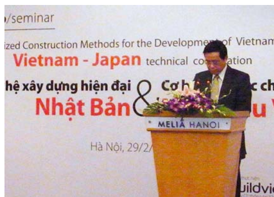
ティエン局長ご挨拶