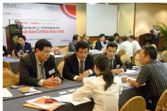
ビジネスマッチング風景