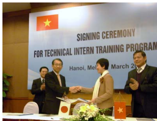
大藤審議官とホンミー副局長