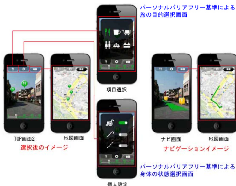
図. 移動支援サービスのイメージ