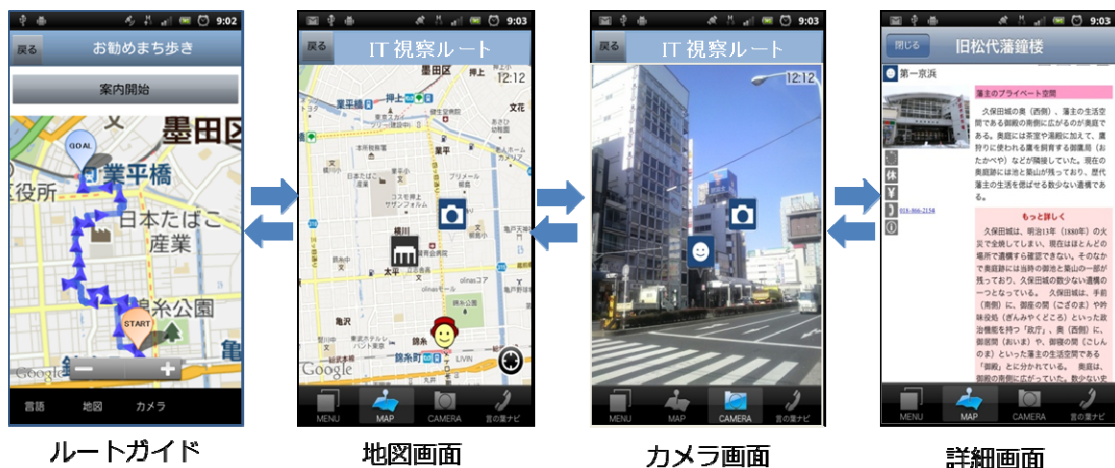
図. 移動支援サービスのイメージ