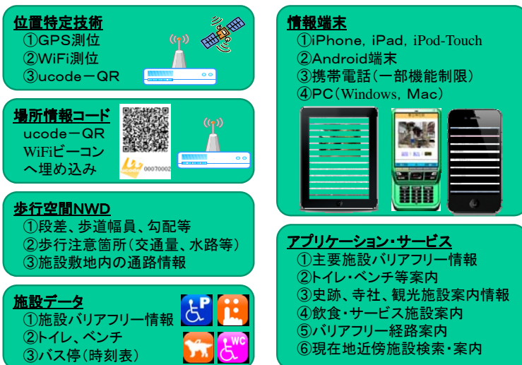
図. 移動支援サービスのイメージ