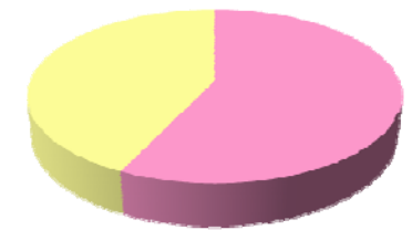
土砂災害による犠牲者の約6割が高齢者