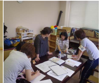
手作りハザードマップの作成 (石川県七尾市)