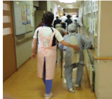
施設内の避難場所への移動訓練 (山形県村山市)