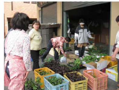
A・Cネットワークグループ(札幌市)