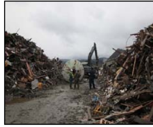
(東日本大震災における道路の啓開状況)

○首都直下地震や南海トラフの巨大地震等様々な災害に備えた「命の道」の確保の必要性