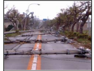
(台風による道路の被災状況)