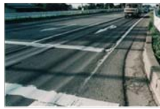
(舗装のわだち掘れ)

○首都直下地震や南海トラフの巨大地震等様々な災害に備えた「命の道」の確保の必要性