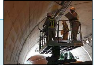
(道路構造物の点検)