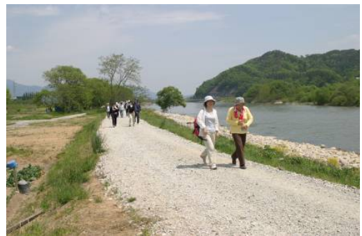
管理用道路をフットパスとして活用（最上川）

ハード支援： 治水上及び河川利用上の安全・安心に係る河川管理施設の整備を通じ、まちづくりと一体となった水辺整備を支援。