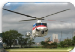
市町村長の右腕となる職員(リエゾン)を派遣