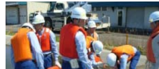
排水ポンプ車による緊急排水