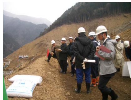
尼政府公共事業省の現地視察状況(平成24年2月)

平成24年2月 日尼両政府による政策対話 尼政府公共事業省幹部が来日、平成23年に台風12号で紀伊山地で発生した天然ダムを視察