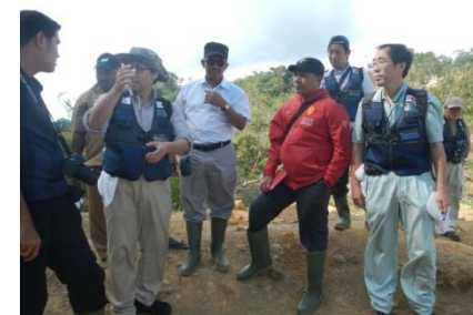
短期専門家の技術指導状況(平成24年9月)