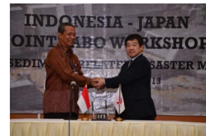
日尼砂防ワークショップ(平成25年2月)

平成25年2月 日尼砂防ワークショップを開催 土木研究所が土研式水位観測ブイ(投下型)を尼国公共事業省と共同で天然ダム湖に設置。以後、決壊まで共同監視。 水位情報等をもとに、対応が検討され、避難措置につながった。