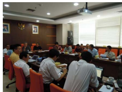
尼国公共事業省幹部と意見交換(平成24年9月)

平成24年9月 尼政府公共事業省幹部が来日し天然ダム対策について意見交換 国交省から短期専門家を派遣し、天然ダムの監視・観測、応急対策等について現地です技術指導