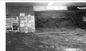
福岡市営地下鉄博多駅(平成15年7月)