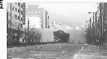
倒壊し避難路を塞いだ建築物