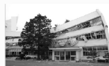
地震により倒壊した大規模建築物

○これらの規制・予算措置とあわせ、本特例措置を講ずることにより、耐震改修を強力に推進する必要。