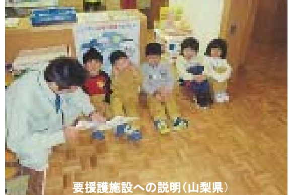
要援護施設への説明(山梨県)