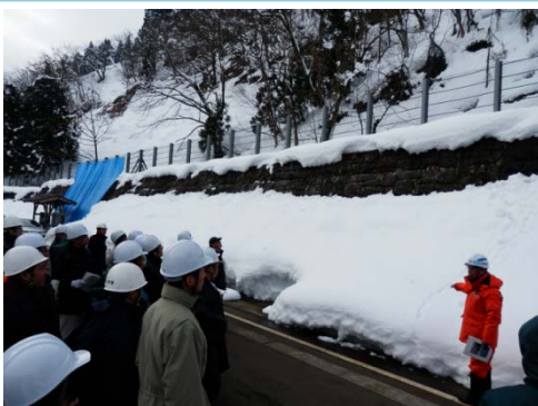
雪崩災害に対する警戒体制強化に関する講習会(新潟県)