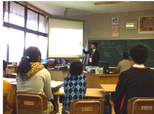
小学生を対象とした雪崩災害教室(鳥取県)