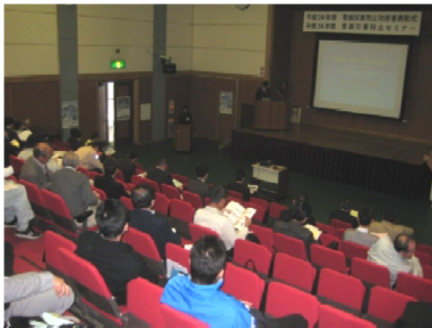
雪崩災害防止セミナー(滋賀県)