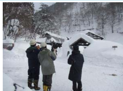
県・市町村雪崩危険箇所合同パトロール(秋田県)