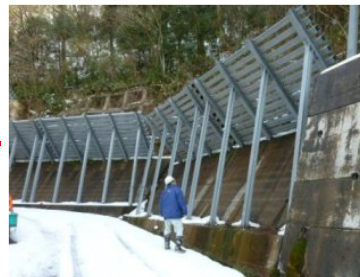
点検結果の公表(富山県ホームページ)

施設の機能に影響を及ぼすような損傷等は確認されませんでした が、集落を雪崩災害から守るため、引き続き施設の整備や適切な管理を実施します。