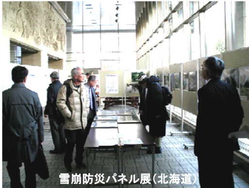
雪崩防災パネル展(北海道)