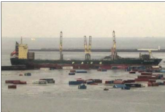
東日本大震災における貨物の流出状況