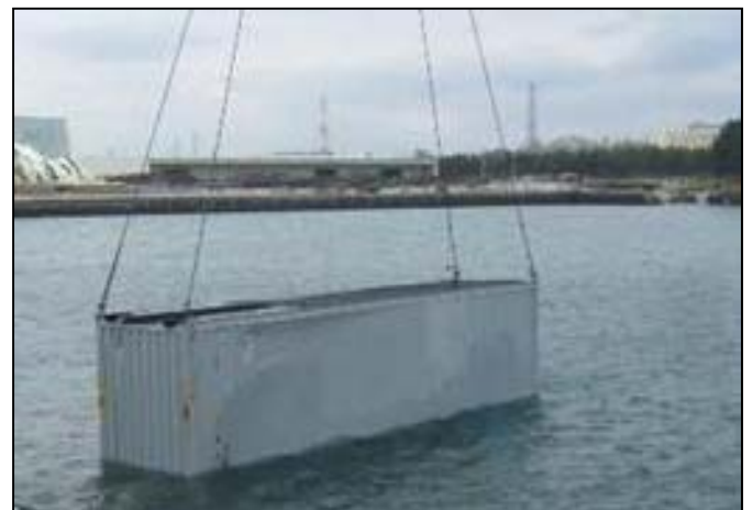
流出したコンテナの除去作業