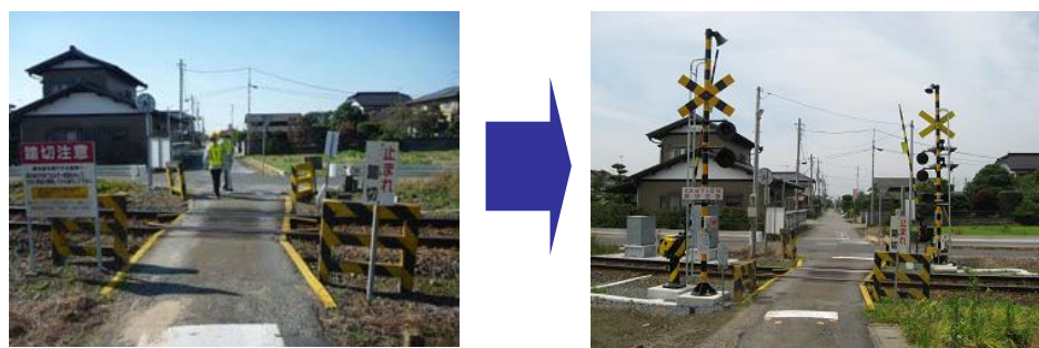
図18:踏切遮断機・警報機の整備