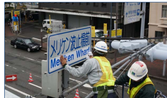
兵庫県神戸市での施工の様子

(代表的なフローを示したものであり、各地域の取組の流れが、本フローと異なる場合がある)