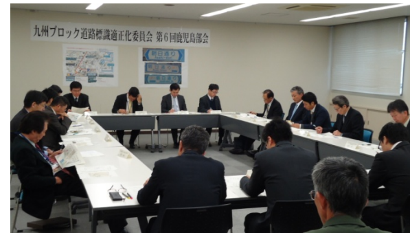
標識適正化委員会の様子