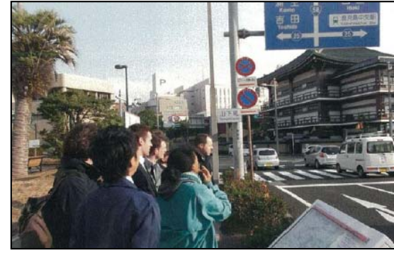
鹿児島市での点検の様子