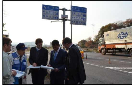
岡山県倉敷市での点検の様子