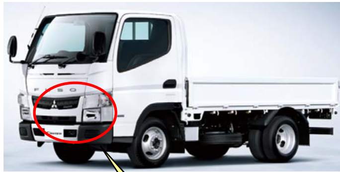
クラッチ制御用油圧バルブ