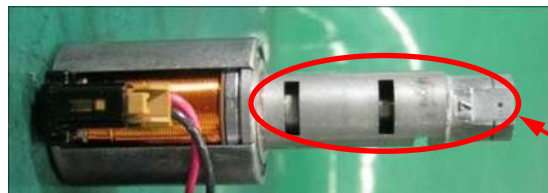
クラッチ制御用油圧バルブ