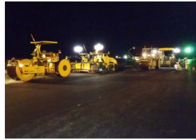
（基本施設舗装の改良状況）