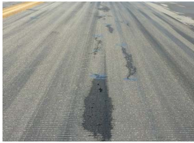
（老朽化した基本施設舗装）