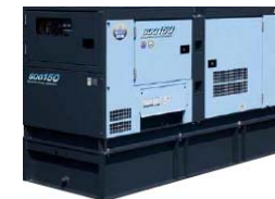
・非常用電源設備