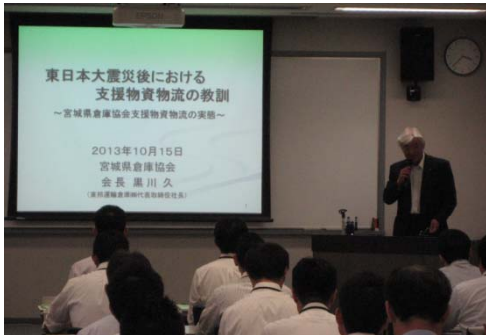
・外部講師による講義