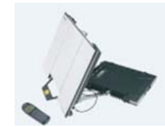
・非常用通信設備