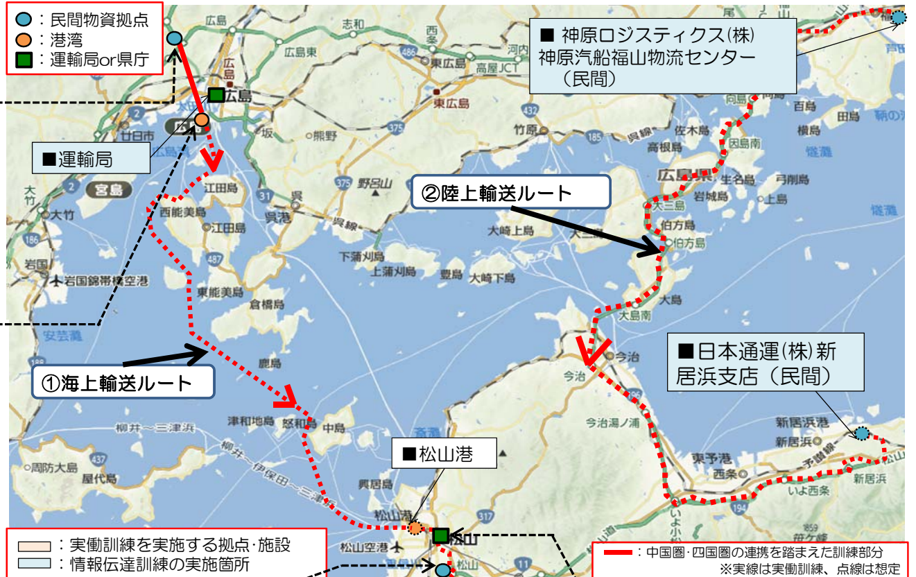
図：訓練の輸送ルート