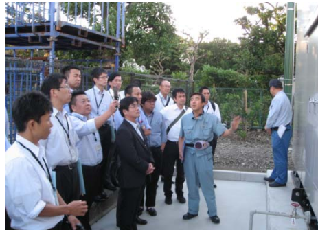
・施設見学(非常用電源設備)