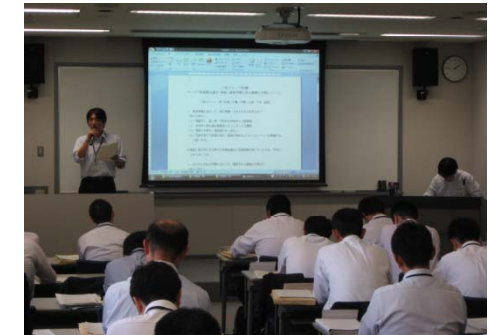
・討議内容の発表