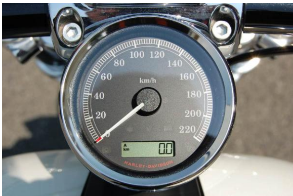
燃料警告灯消灯状態