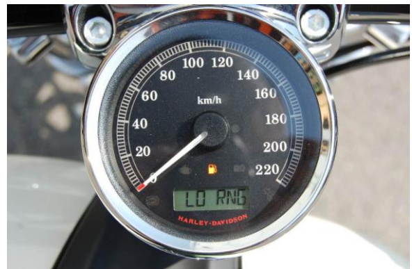
燃料警告灯点灯状態