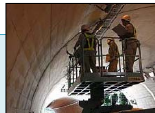
(道路構造物の点検)