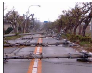
(台風による道路の被災状況)