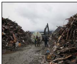
(東日本大震災における道路の啓開状況)

○首都直下地震や南海トラフの巨大地震等様々な災害に備えた「命の道」の確保の必要性