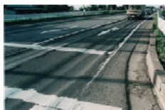
(舗装のわだち掘れ)

○首都直下地震や南海トラフの巨大地震等様々な災害に備えた「命の道」の確保の必要性