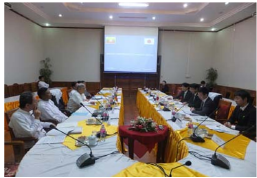
ハン・セイン運輸副大臣との会談