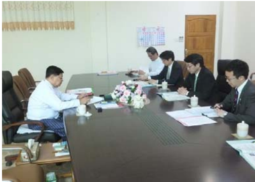
ソー・テイン大統領府付大臣との会談

ティラワ地区で運用中の港湾ターミナル（MITT※）、及びティラワ SEZ の現場視察を行いました。