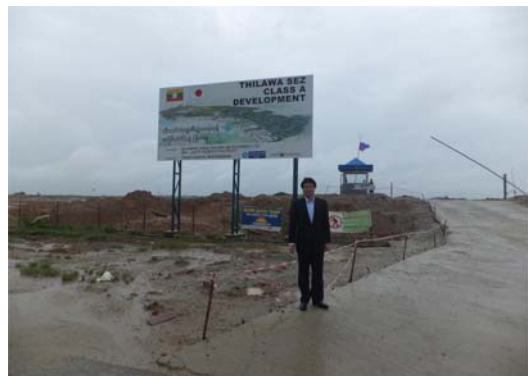
ティラワ SEZ 視察

※MITT; Myanmar International Terminals Thilawa