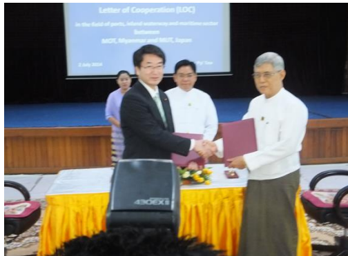
協力文書の署名式