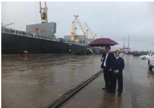
ティラワ地区(MITT)視察