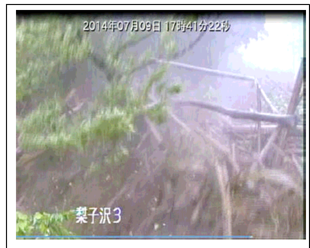
国土交通省17時41分梨子沢CCTV 土石流発生状況