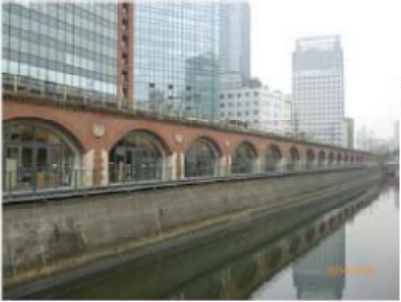
第4回懇談会 [平成26年2月27日]