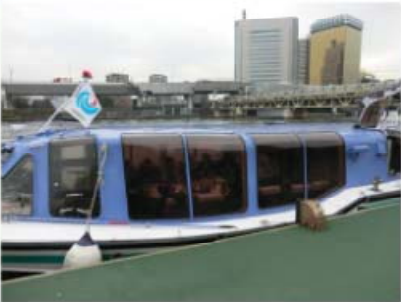
第1回懇談会 [平成25年12月27日]

各界の有識者等からなる懇談会を設置し、ご意見・アイデア等をいただきながら、美しさと風格を備えた魅力的な水辺とまちの未来創造に向けたメッセージを打ち出し、発信する。