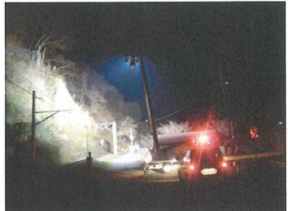
JR 大糸線の被災箇所（小谷村）に派遣中の照明車（11 月 23 日）