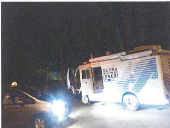
国道 148 号の被災箇所（白馬村）に派遣中の衛星通信車（11 月 23 日）