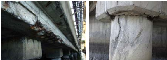
鉄筋コンクリート桁における 主要な鉄筋の腐食 橋脚部における コンクリートのひび割れ

○建設開始後半世紀を経て老朽化が進む高速道路の更新を、厳しい財政状況の中でも迅速かつ計画的に推進する必要