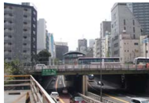
未活用の状態にある 首都高速道路の上部空間 諸外国と比べて広いインター チェンジ間隔(スマートICを除く)