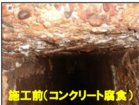
施工前(コンクリート腐食)