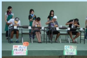
大学生が企画したイベント