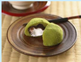
地元名産品「霧の森大福」