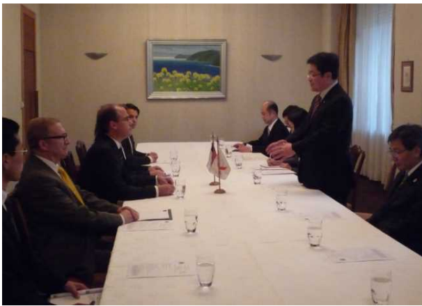
ウンドゥラーガ公共事業大臣との会談

会談後、アルゼンチンの港湾の整備・運営に関する相互協力を促進するための覚書に署名を行いました。アルゼンチンとの間で港湾に関する覚書に署名を行うのは初めてです。