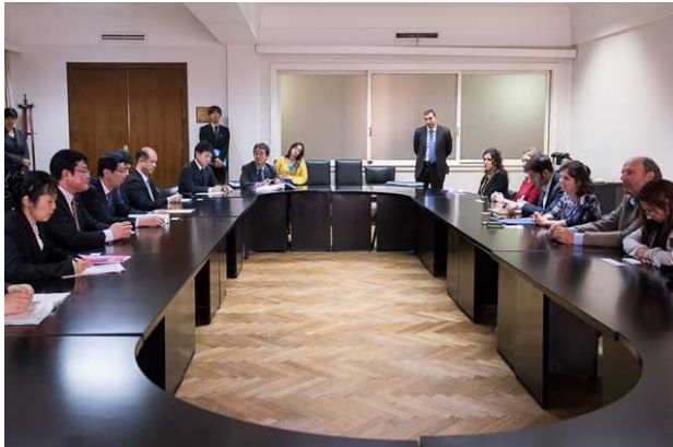
ゴンサレス経済・財政副大臣との会談