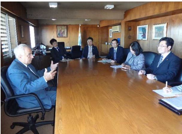
ロッシ運輸公共事業大臣との会談