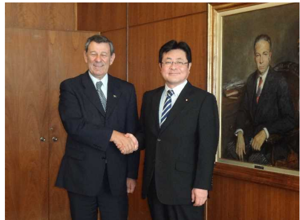
ニン・ノボア外務大臣との会談