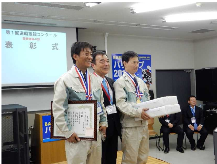
表彰式(中央は今治市長)