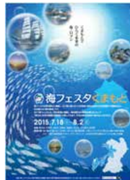
海フェスタくまもとポスター

2015年は、熊本県有明海沿岸地域の7市1町（熊本市、天草市、玉名市、宇城市、荒尾市、宇土市、上天草市、長洲町）で、有明海の代名詞でもある干潟の魅力を全国に発信し、「くまもとでひらく未来の海・ロマン」をメインテーマに地域間の交流を深めるとともに、地域全体の発展及び海洋振興を図ることを目的に開催される。