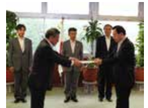
佐原豊橋市長に対し開催決定通知書を交付する太田大臣