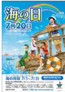
2015年度「海の日」ポスター

期間中には全国各地で海に親しむためのレクリエーション、体験乗船、施設見学等の様々なイベントが展開され、その最大のイベントとして、「海フェスタ」を開催している。