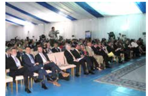
▲（写真）2014年、モロッコで開催されたパラレルイベントの国際シンポジウムの様子。

今年のパラレルイベントは、国内外から多数の有識者を招聘して海事教育及び訓練に関する「国際シンポジウム」を開催する。世界から多くの海事関係者の参加を得て、将来の海洋人材の教育及び訓練のあり方について議論し、とりまとめる。