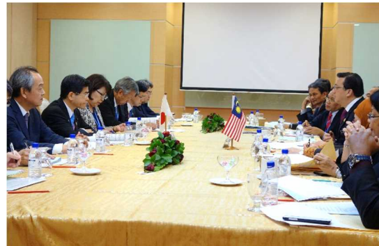
リオ・マレーシア運輸大臣との会談