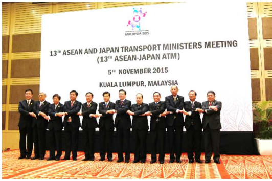
日 ASEAN 交通大臣会合