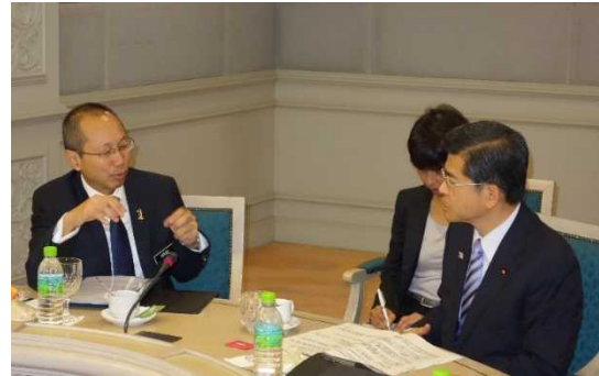
ワヒド・マレーシア首相府大臣との会談